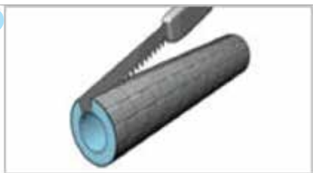
Otvoriti po dužini