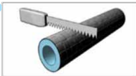
Odrezati na mjeru